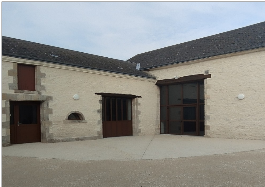
Vue depuis la cour au 15 rue Fleurie

La salle se situe 15 rue Fleurie, en lieu et place des anciens ateliers municipaux qui ont déménagé rue de Beaumont. Le montant des travaux démarrés en Mars 2024 s'élève à 167 765 € et a été subventionné à 80 %. La rénovation de la maçonnerie, les menuiseries, l'isolation, le chauffage par pompe à chaleur permettent au bâtiment de passer de catégorie G à B ce qui procurera confort et économie d'énergie.