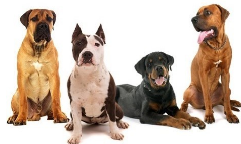
De gauche à droite : Mastiff, American Staffordshire terrier, Rottweiler, Tosa

Catégorie 2 : Chiens de garde et de défense, inscrits au LOF. Cela inclut les American Staffordshire Terrier, Rottweiler (race ou type), et Tosa.