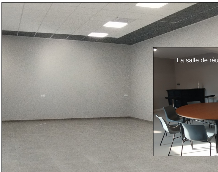
La salle de théâtre à aménager