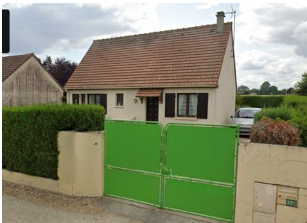
22 bis Rue du Pavé, cette habitation va accueillir le futur cabinet dentaire

Eh oui ! Bientôt un cabinet dentaire sur notre commune. La municipalité est devenue propriétaire d'un pavillon au 22 bis rue du Pavé pour y installer une dentiste qui prendra ses fonctions début janvier 2025. Le bâtiment a été acheté dans un premier temps par un organisme financier public (EPFLI) réservé uniquement aux collectivités pour un montant de 160 000 euros qui l'a revendu à la commune pour 1 euro symbolique. Comment cela fonctionne ? L'EPFLI achète un bien et le rétrocède suivant les cas immédiatement ou pas. Le portage (sorte de crédit au taux de 1,5%) est conclu pour une durée déterminée avec les élus, dans notre cas pour 15 années, durée maximum qui peut être modifiée à tout moment. Cet outil de travail permet aux collectivités d'avancer et d'étaler la dette de la commune. Les mêmes opérations ont été effectuées pour les ateliers municipaux et le cabinet de kinésithérapie.